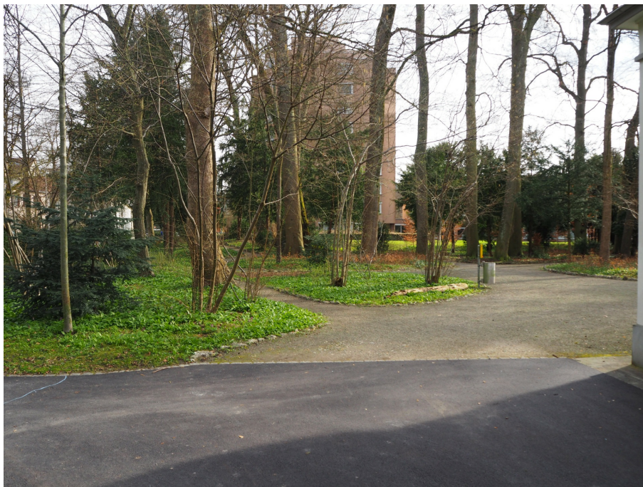
Ensemble «Adlergarten», Parkanlage (230MAPARK00088) östlich des Wohnhauses «Fortuna» (230MA00088), 21.03.2017 (Bild Nr. D101128_58).