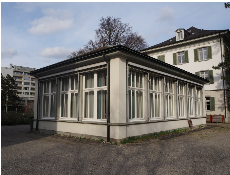
Ensemble «Adlergarten», ehem. Gewächs-/Waschhaus (230MAWASCH00088), Ansicht von SW, 21.03.2017 (Bild Nr. D101128_68).