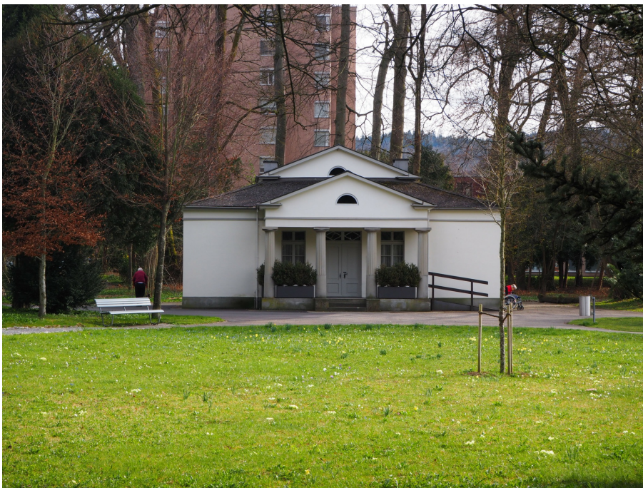
Ensemble «Adlergarten», Pavillon (230MA00091), Ansicht von N, 21.03.2017 (Bild Nr. D101128_60).