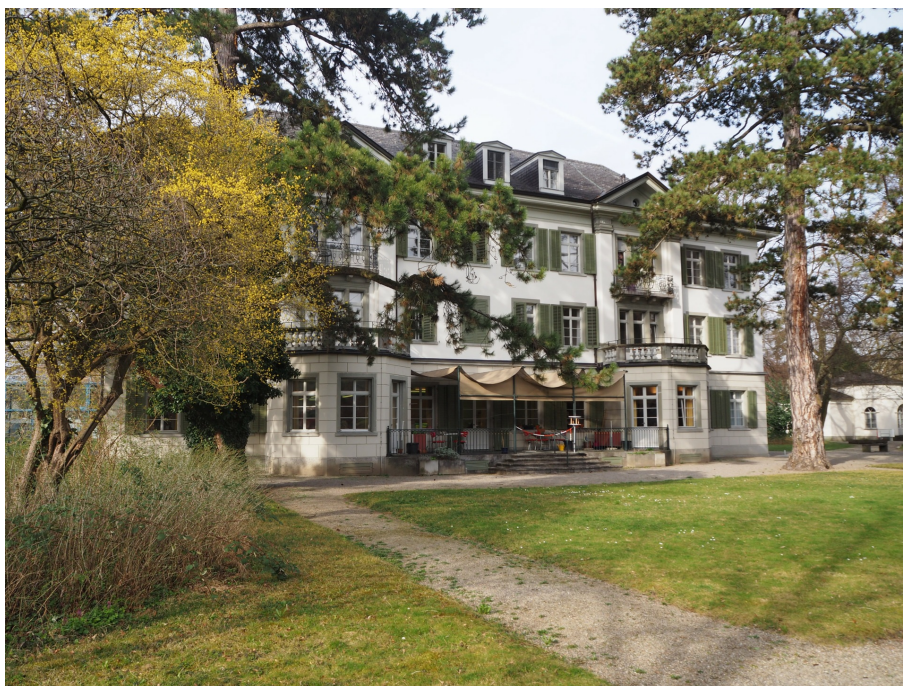
Ensemble «Adlergarten», Wohnhaus «Fortuna» (230MA00088), Ansicht von S, 21.03.2017 (Bild Nr. D101128_73).