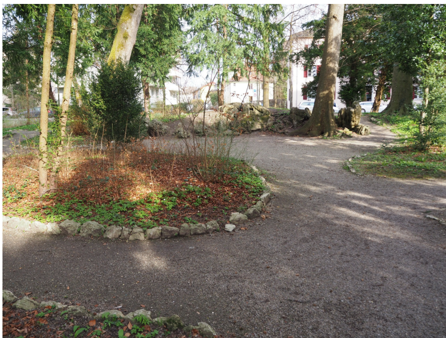
Ensemble «Adlergarten», Parkanlage (230MAPARK00088) östlich des Wohnhauses «Fortuna» (230MA00088), 21.03.2017 (Bild Nr. D101128_54).