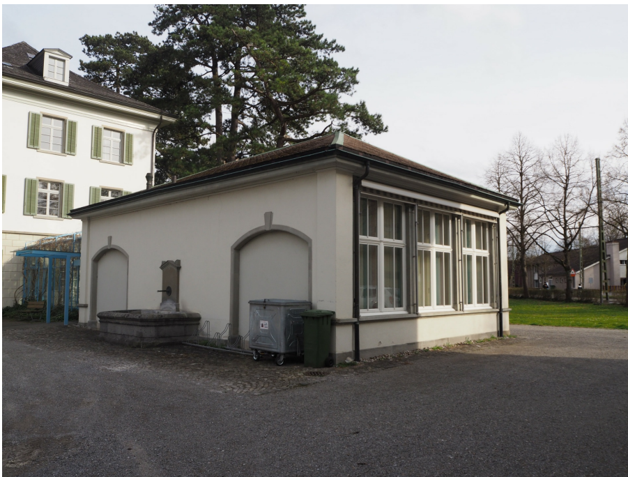
Ensemble «Adlergarten», ehem. Gewächs-/Waschhaus (230MAWASCH00088), Ansicht von NW, 21.03.2017 (Bild Nr. D101128_67).