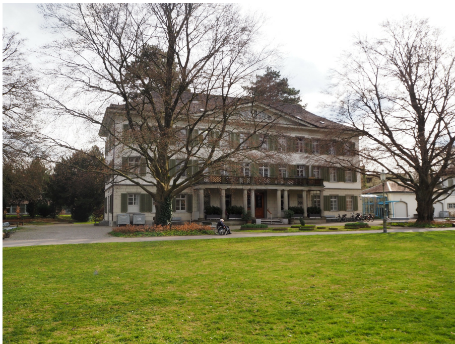
Ensemble «Adlergarten», Wohnhaus «Fortuna» (230MA00088), Ansicht von NO, 21.03.2017 (Bild Nr. D101128_62).