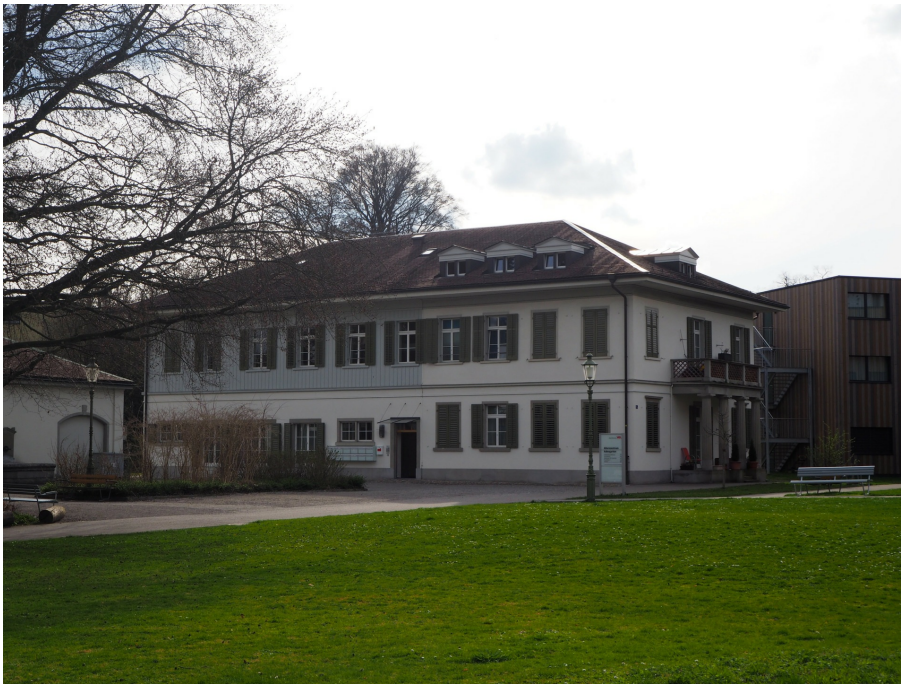
Ensemble «Adlergarten», ehem. Ökonomiegebäude (230MA00089), Ansicht von NO, 21.03.2017 (Bild Nr. D101128_63).