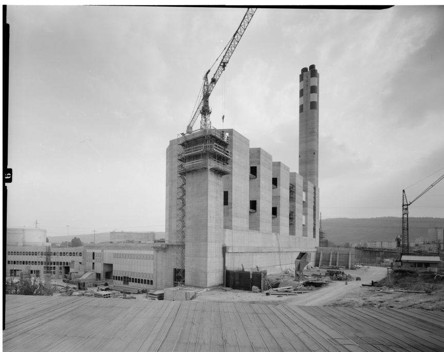
Heizkraftwerk Aubrugg, v. l. n. r. Dienstgebäude (Vers. Nr. 01953), Maschinenhalle (069HALLE01953), Kesselhaus (069KESSEL01953), Hochkamin (069KAMIN01953), rechts ist an der Fassade des Kesselhauses die Schalung für die Stützmauern zur Terrainauffüllung sichtbar, Ansicht von N, 16.09.1977 (Bild Nr. U42735).