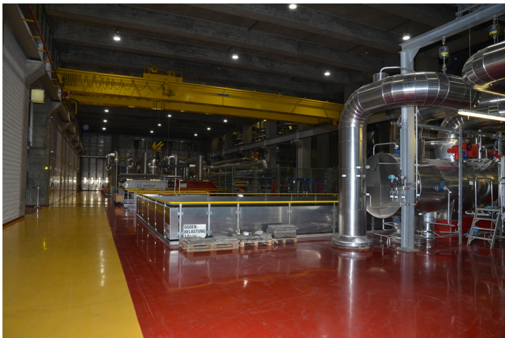
Heizkraftwerk Aubrugg, Inneres der Maschinenhalle (069HALLE1953), 16.10.2017 (Bild Nr. D100691_76).