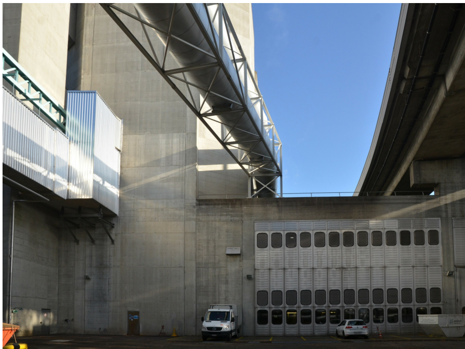
Heizkraftwerk Aubrugg, Süd Hof, links Kesselhaus (069KESSEL01953), rechts Maschinenhalle (069HALLE1953) mit den auswechselbaren modularen Aluminiumpaneelen, Ansicht von SW, 16.10.2017 (Bild Nr. D100580_69).