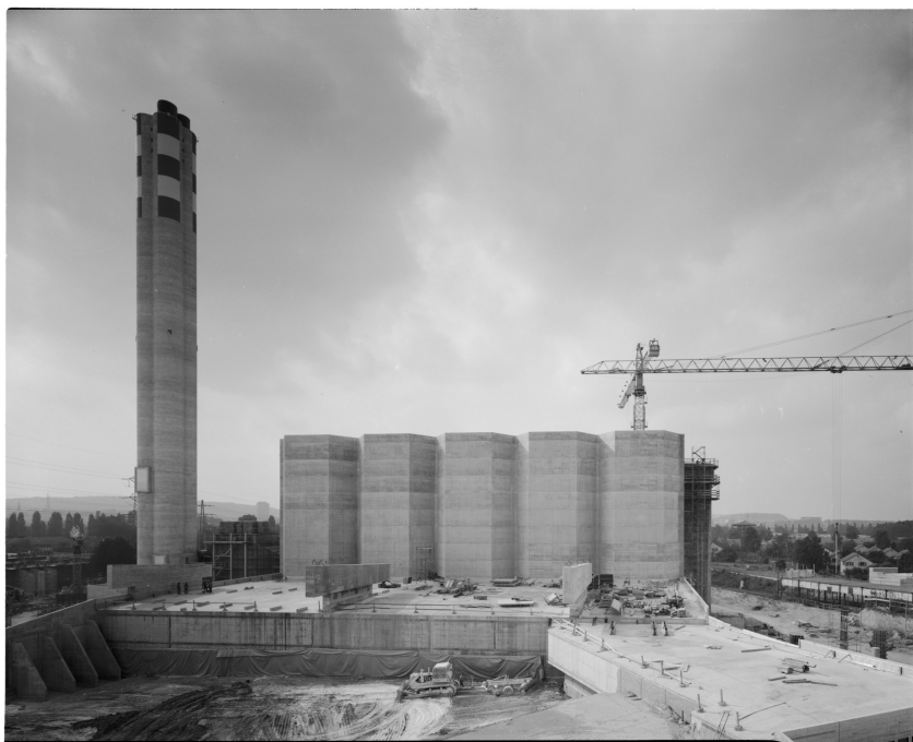
Heizkraftwerk Aubrugg, im Vordergrund Maschinenhalle (069HALLE01953) mit den drei Pfeilerschieben für die Autobahnüberwerfungen und die Grube vor dem Auffüllen des Terrains, rechts das Dach des Dienstgebäudes (Vers. Nr. 01953), Ansicht von SO, 16.09.1977 (Bild Nr. U42734).