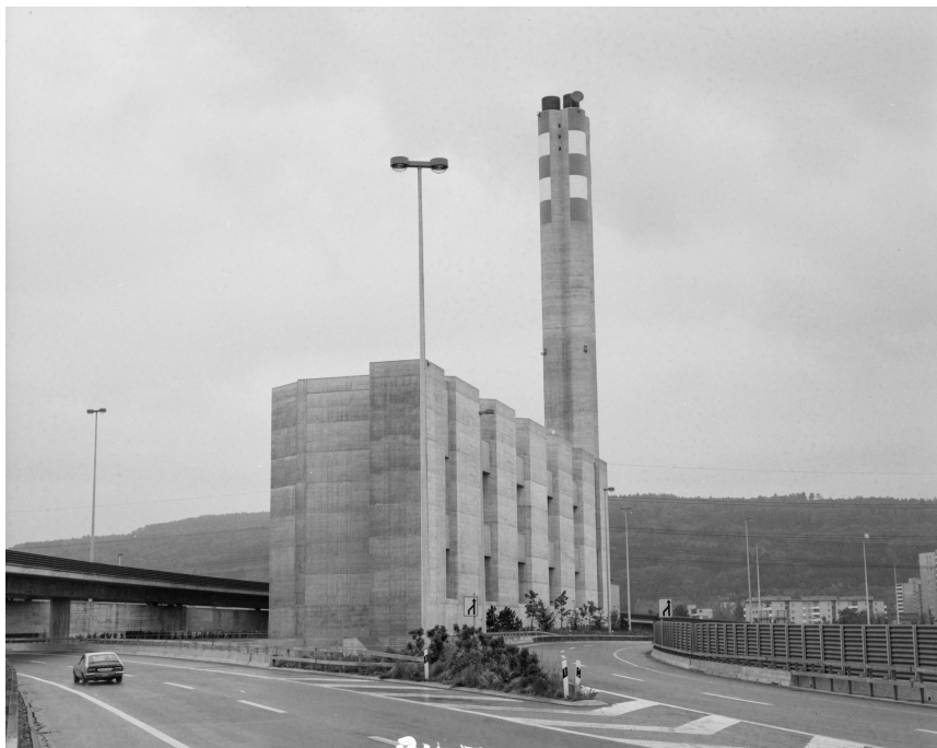
Heizkraftwerk Aubrugg, «Autobahntor» zur Stadt Zürich, Ansicht von N, 22.05.1981 (Bild Nr. D100691_75).