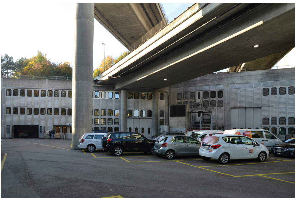
Heizkraftwerk Aubrugg, Nordhof, links Dienstgebäude (Vers.-Nr. 01953), das die Autobahnunterwerfung trägt, rechts Maschinenhalle (069HALLE1953), deren Konstruktion die beiden Autobahnüberwerfungen trägt, Ansicht von N, 16.10.2017 (Bild Nr. D100580_62).