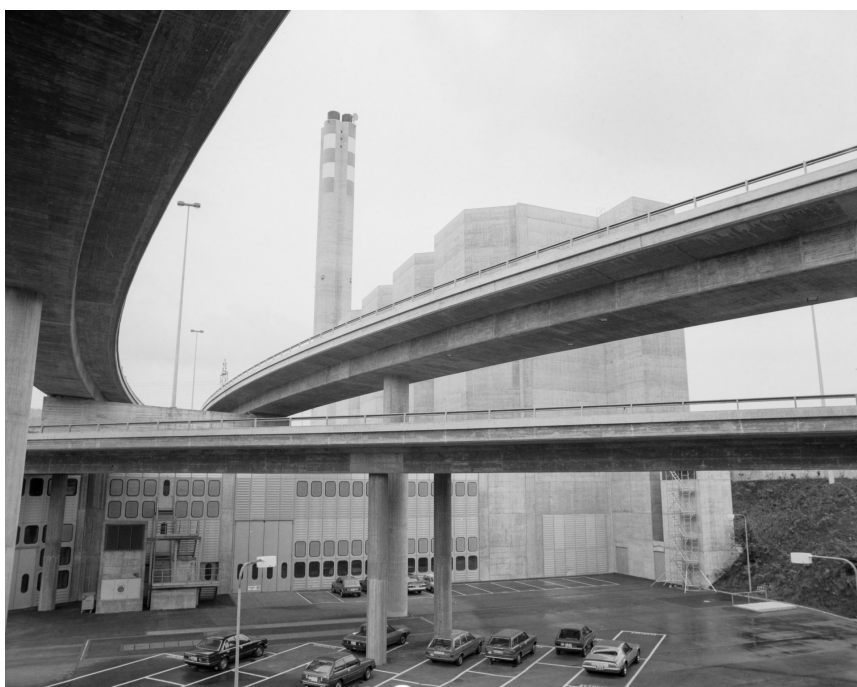
Heizkraftwerk Aubrugg, Nordhof, links Dienstgebäude (Vers. Nr. 01953) mit Autobahnunterwerfung, in der Mitte Maschinenhalle (069HALLE01953) mit den beiden Autobahnüberwerfungen, hinten rechts Kesselhaus (069KESSEL01953), Ansicht von N, 22.05.1981 (Bild Nr. D100691_74).