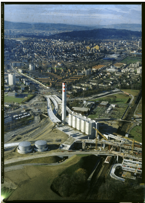
Heizkraftwerk Aubrugg, Flugaufnahme während des Autobahnbaus, Ansicht von NO, 01.02.1979 (Bild Nr. D100691_73).