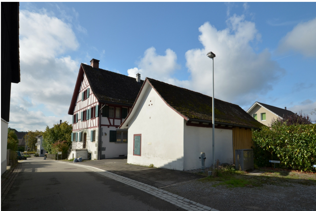
Ref. Pfarrliegenschaft, Ansicht von NO, 31.10.2021 (Bild Nr. D101385_02).