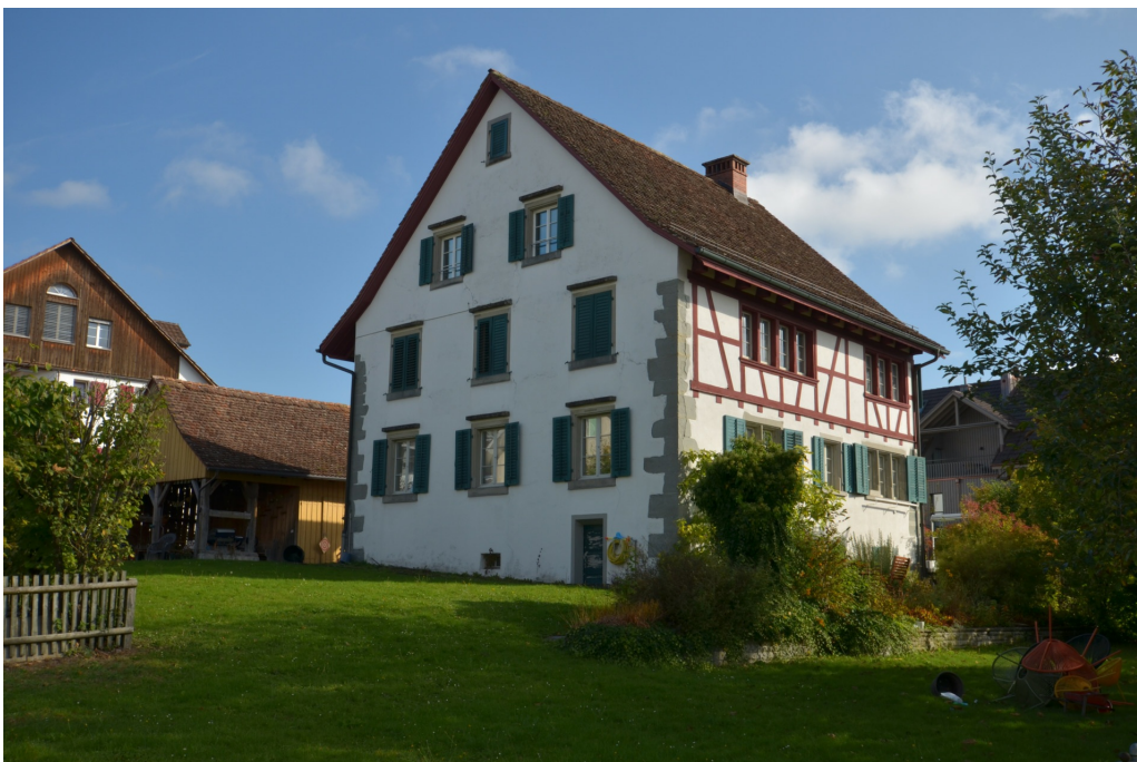
Ref. Pfarrliegenschaft, Pfarrhaus (Vers.-Nr. 00200), links Holzschopf am ehem. Waschhaus (Vers.-Nr. 00199), Ansicht von SW, 31.10.2021 (Bild Nr. D101385_05).