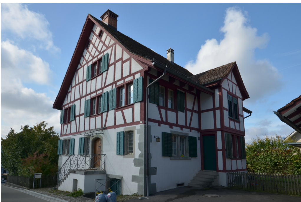
Ref. Pfarrliegenschaft, Pfarrhaus (Vers.-Nr. 00200), Ansicht von NO, 31.10.2021 (Bild Nr. D101385_03).