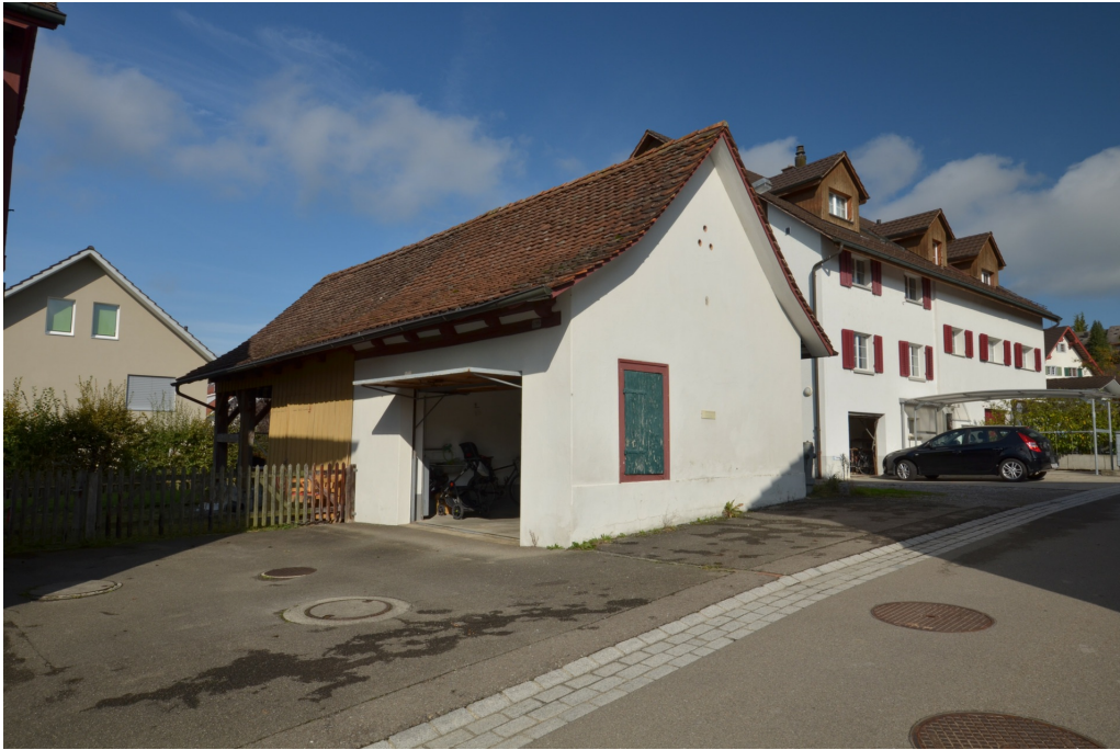
Ansicht von SO, 31.10.2021 (Bild Nr. D101385_06).