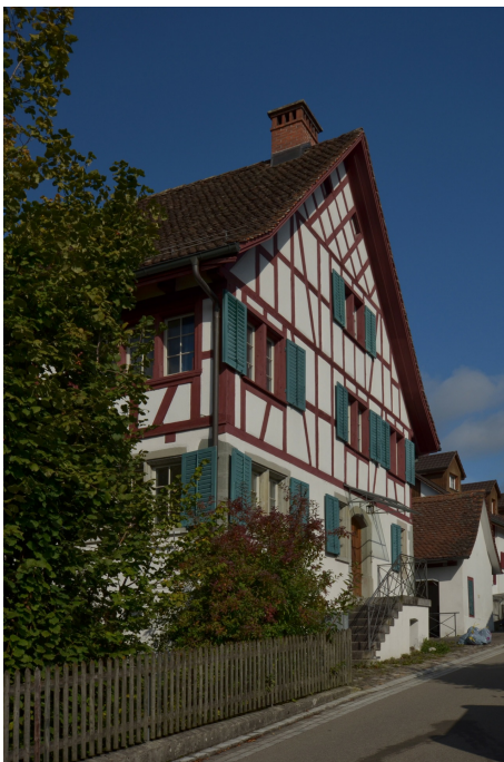
Ref. Pfarrliegenschaft, Pfarrhaus (Vers.-Nr. 00200) und ehem. Waschhaus mit Holzschopf (Vers.-Nr. 00199), Ansicht von SO, 31.10.2021 (Bild Nr. D101385_04).