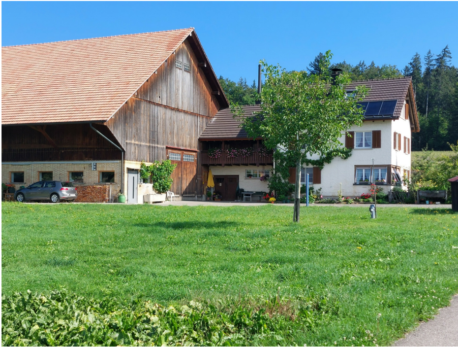
Zelglihof, grosse Stallscheune, Zwischenbau und Wohnhaus, Ansicht von S, 10.08.2022 (Bild Nr. D100692_82).