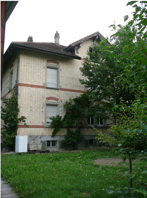
Direktions-, Dienstgebäude und Angestelltenwohnhäuser der Strafanstalt, Wohnhaus für Beamte (Vers. Nr. 00473), Ansicht von SO, 13.08.2013 (Bild Nr. D100654_24).