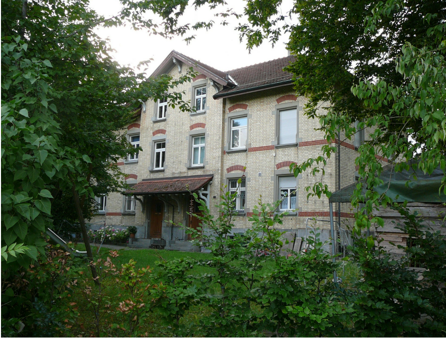
Direktions-, Dienstgebäude und Angestelltenwohnhäuser der Strafanstalt, Wohnhaus für Beamte (Vers. Nr. 00473), Ansicht von NW, 13.08.2013 (Bild Nr. D100654_22).