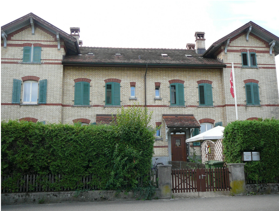
Direktions-, Dienstgebäude und Angestelltenwohnhäuser der Strafanstalt, Wohnhaus für Angestellte (Vers. Nr. 00488), Ansicht von NW, 13.08.2013 (Bild Nr. D100654_20).