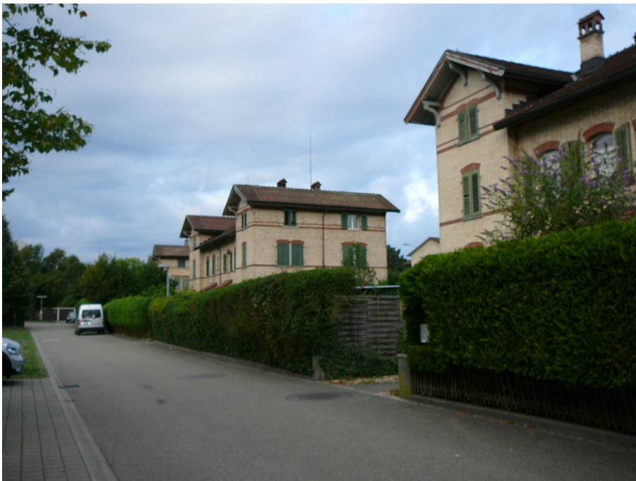
Direktions-, Dienstgebäude und Angestelltenwohnhäuser der Strafanstalt, Wohnhäuser für Angestellte (Vers. Nr. 00485, 00486, 00487), Ansicht von NO, 13.08.2013 (Bild Nr. D100654_14).