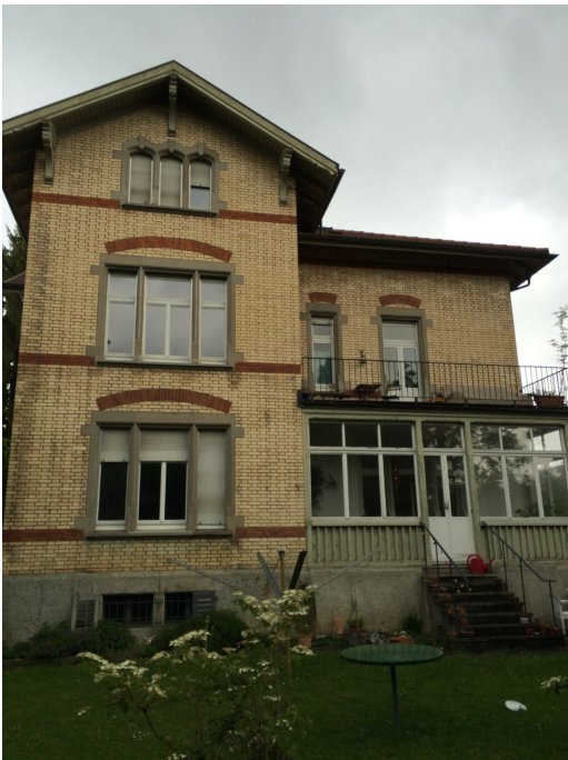
Direktions-, Dienstgebäude und Angestelltenwohnhäuser der Strafanstalt, Ansicht Direktorenhaus, Blick von O, 13.08.2013 (Bild Nr. D100663_25).