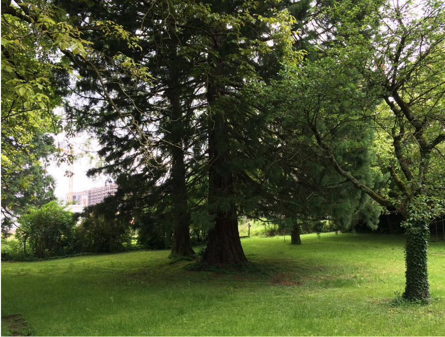
Direktions-, Dienstgebäude und Angestelltenwohnhäuser der Strafanstalt, Ansicht Garten Direktorenhaus, 13.08.2013 (Bild Nr. D100663_27).