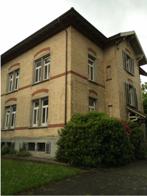
Direktions-, Dienstgebäude und Angestelltenwohnhäuser der Strafanstalt, Ansicht Direktorenhaus, Blick von N, 13.08.2013.