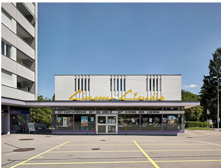
Kino «Claudia», Kinogebäude (062KINO00400), Eingangsfront mit verglastem Foyer, Ansicht von W, 26.09.2019 (Bild Nr. D100671_30).