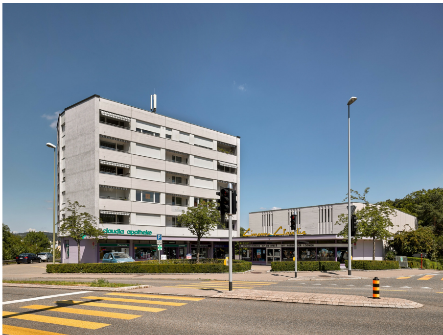
Kino «Claudia», links Wohn- und Geschäftshaus (Vers. Nr. 00400), rechts Kinogebäude (062KINO00400), Ansicht von SW, 26.09.2019 (Bild Nr. D100671_29).