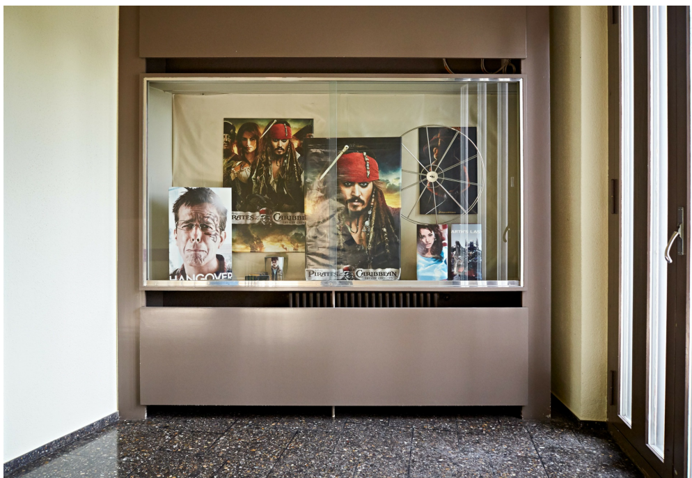
Kino «Claudia», Kinogebäude (062KINO00400), Schaukasten im Foyer, 26.09.2019 (Bild Nr. D100671_23).