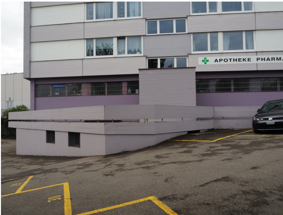
Kino «Claudia», Wohn- und Geschäftshaus (Vers. Nr. 00400), Keller-/Garagengeschoß mit Vorplatz, Kellervorbau und Hintereingang, Ansicht von N, 29.08.2017 (Bild Nr. D100671_54).