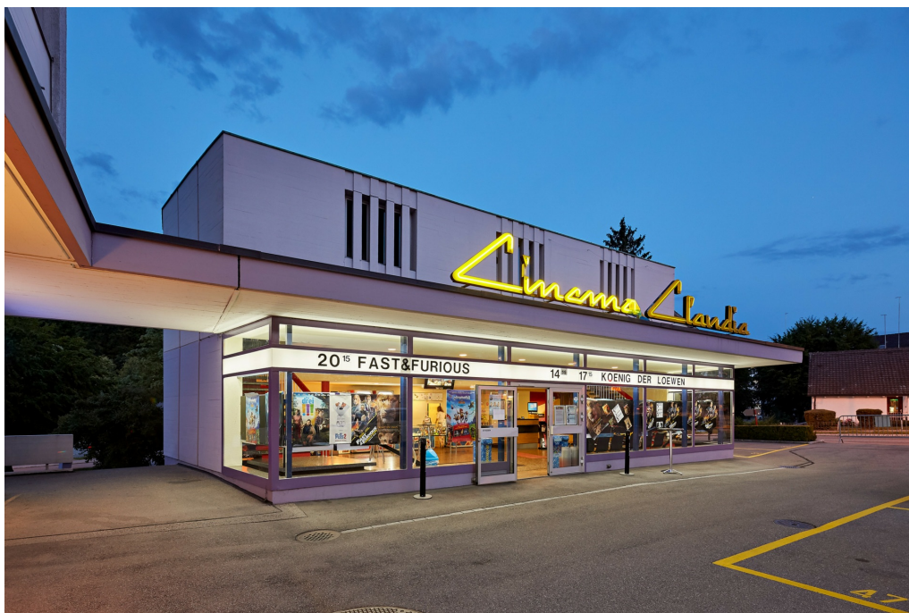
Kino «Claudia», Kinogebäude (062KINO00400), Ansicht von NW, 26.09.2019 (Bild Nr. D100671_26).