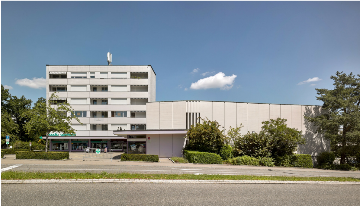
Kino «Claudia», links Wohn- und Geschäftshaus (Vers. Nr. 00400), rechts Kinogebäude (062KINO00400), Ansicht von S, 26.09.2019.