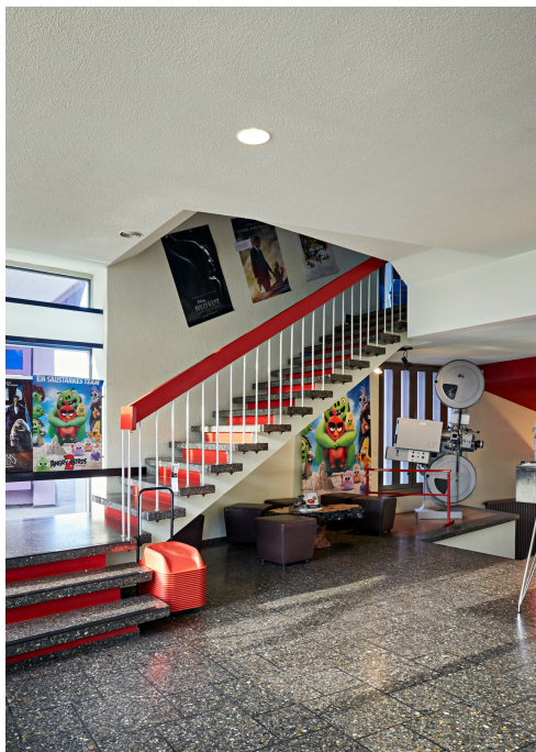
Kino «Claudia», Kinogebäude (062KINO00400), Foyer, Treppe zur Estrade, Blick nach N, 26.09.2019 (Bild Nr. D100671_25).