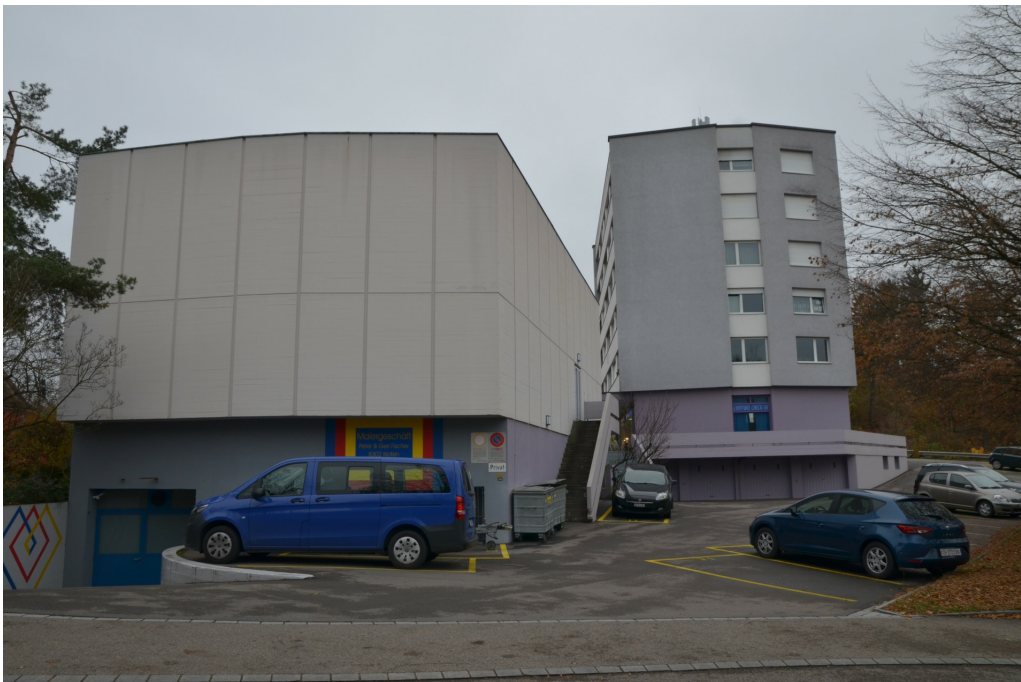
Kino «Claudia», links fensterloser Saal des Kinogebäudes (062KINO00400), rechts Wohn- und Geschäftshaus (Vers. Nr. 00400), Ansicht von O, 16.11.2021 (Bild Nr. D100671_17).