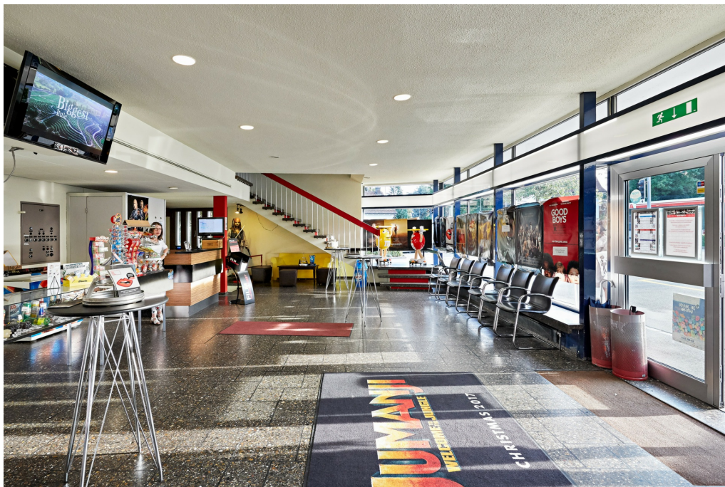
Kino «Claudia», Kinogebäude (062KINO00400), Foyer, Blick nach S, 26.09.2019 (Bild Nr. D100671_22).