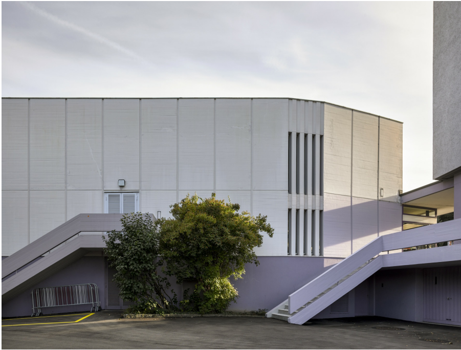
Kino «Claudia», Kinogebäude (062KINO00400) mit Nottreppe und Lichtschlitzen, rechts Betontreppe zwischen Platz und tieferliegendem Niveau, Ansicht von N, 26.09.2019 (Bild Nr. D100671_42).