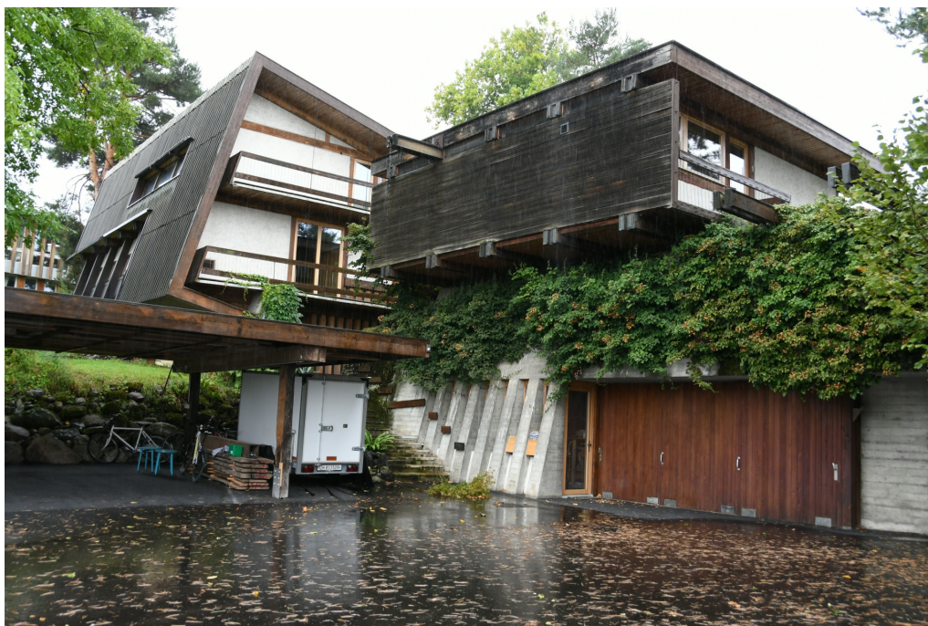
Wohn- und Atelierhaus Studer, links das Wohnhaus und rechts das Atelier (Vers.-Nr. 00340), Ansicht von N, 14.09.2017 (Bild Nr. D100585_25).