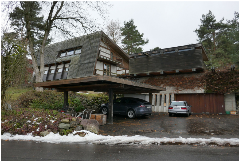
Wohn- und Atelierhaus Studer, links das Wohnhaus und rechts das Atelier (Vers.-Nr. 00340), Ansicht von N, 12.12.2017 (Bild Nr. D100585_31).