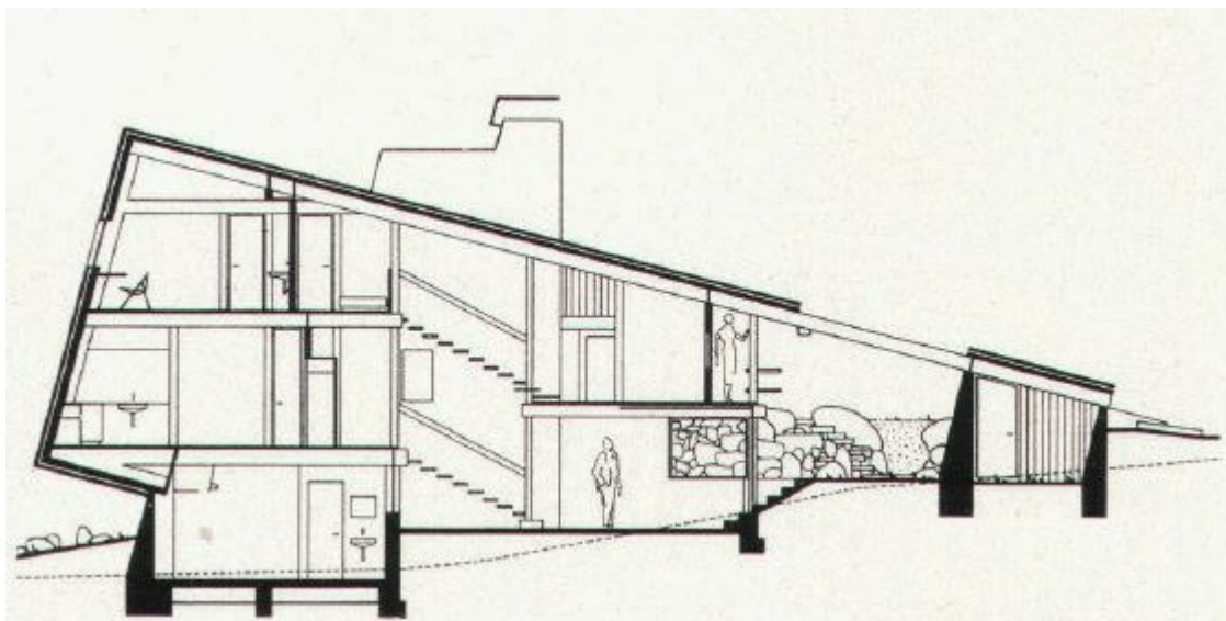
Wohn- und Atelierhaus Studer, Querschnitt Wohnhaus (Vers.-Nr. 00340), rechts Umgebung mit Steingarten und Stall (191UMGEBU00340), in: Werk, Bd. 47, 1960, Nr. 5, S. 160, 01.01.1960, 01.01.1960 (Bild Nr. D100693_06).