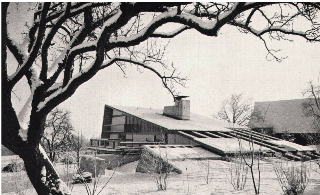
Wohn- und Atelierhaus Studer, Ansicht von NW, in: Werk, Bd. 47, 1960, Nr. 5, S. 158, 01.01.1960, 01.01.1960 (Bild Nr. D100693_07).