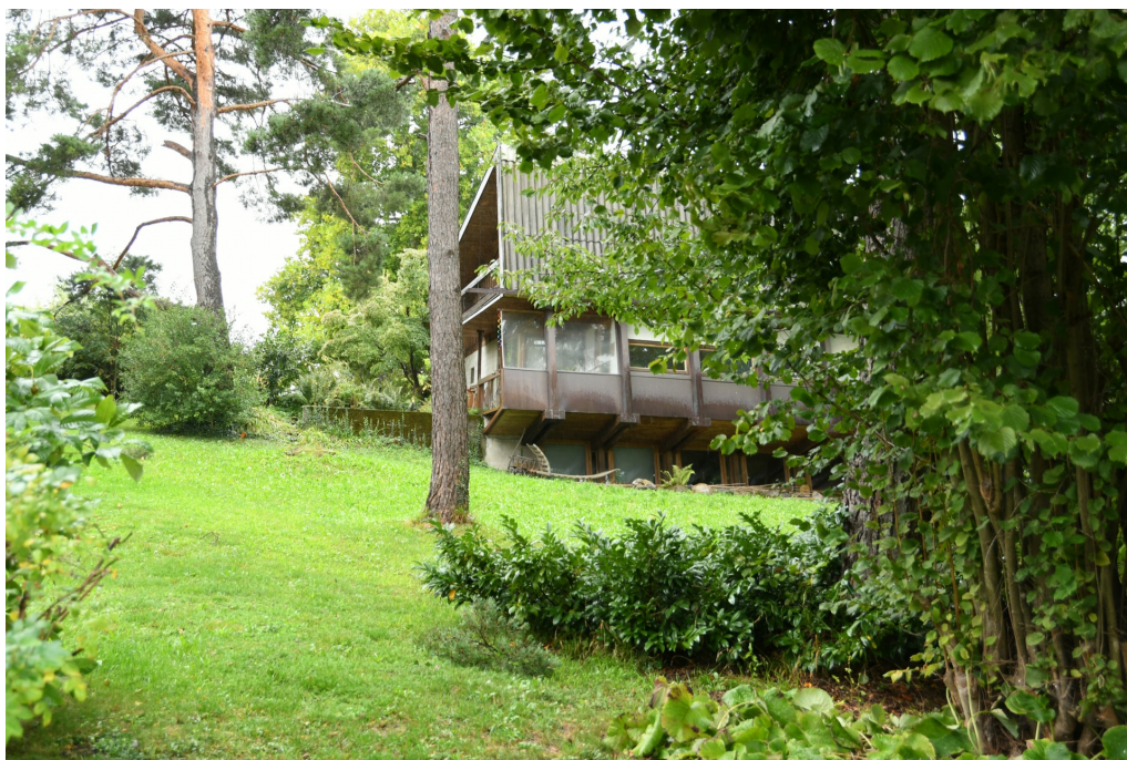
Wohn- und Atelierhaus Studer, Wohnhaus (Vers.-Nr. 00340), Umgebung (191UMGEBU00340), Ansicht von O, 14.09.2017 (Bild Nr. D100585_27).