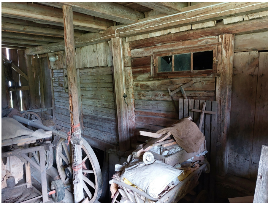
Vielzweckbauernhaus, urspr. Bohlenwand im Stall, Blick nach SO, 10.05.2022 (Bild Nr. D100691_94).