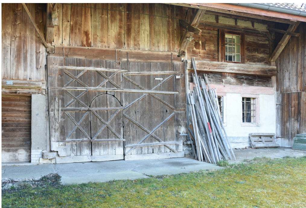
Vielzweckbauernhaus, Nordfassade, Ökonomieteil mit Tenntor und Schwellenschlössern der Aussenständer, rechts daneben Wohnteil mit urspr. Bohlenwand, 08.03.2022 (Bild Nr. D100593_21).