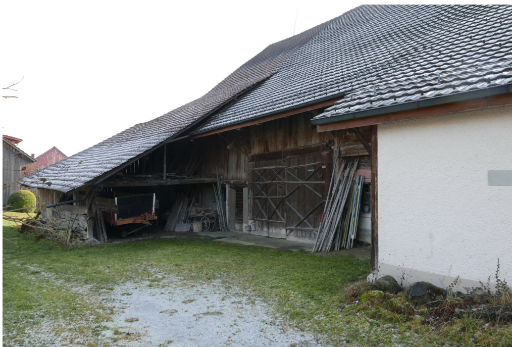
Vielzweckbauernhaus, Nordfassade, Ökonomieteil mit offenem Schopf, Stall, und Tenntor, 27.01.2022.