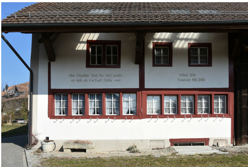
Vielzweckbauernhaus, Hauptfassade im S mit Stubenfenster (Fensterwagen), 08.03.2022.