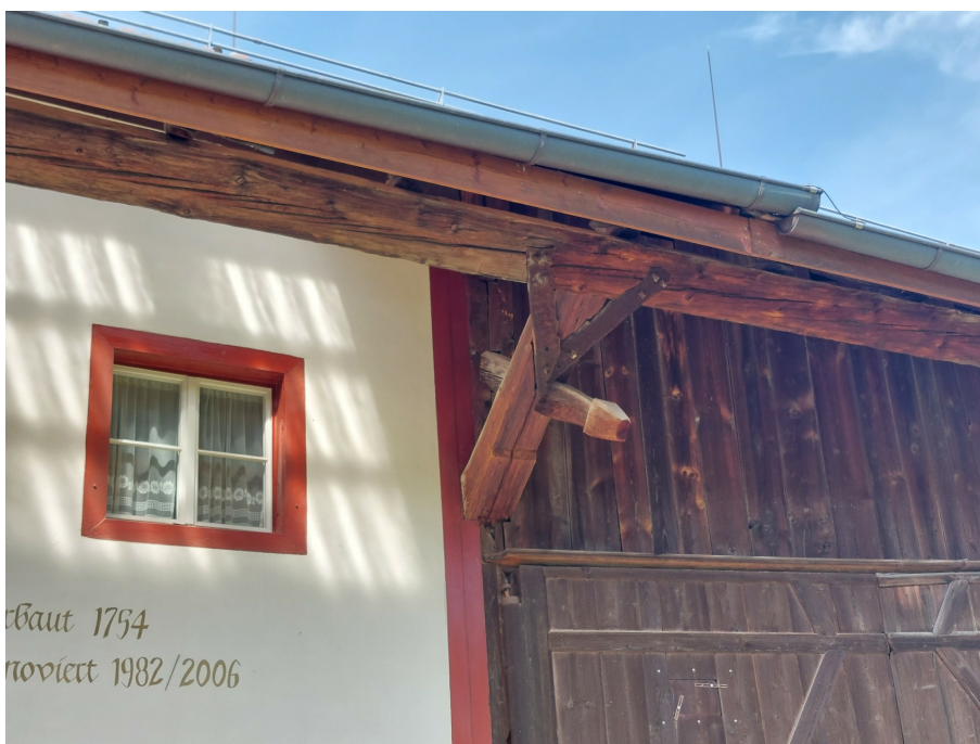
Vielzweckbauernhaus, Hauptfassade im S, Vordachabstützung mit Flugpfette, Bug, Zugband und überblattetem Kopfholz, 10.05.2022 (Bild Nr. D100691_93).