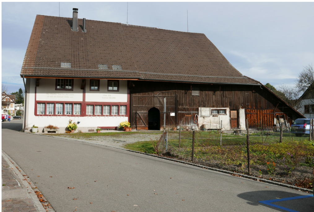
Vielzweckbauernhaus, Hauptfassade im S, Wohnteile und Ökonomieteil mit Tenn, Stall und Schopfanbau, 19.11.2015 (Bild Nr. D100593_01).