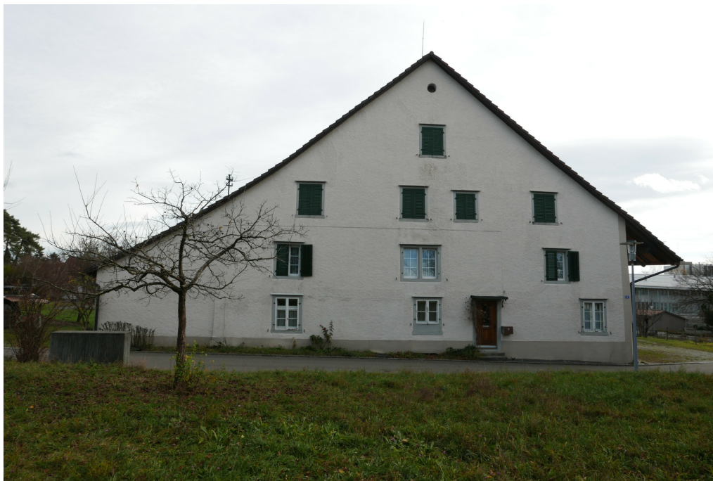
Vielzweckbauernhaus, gemauerte Westfassade mit Haupteingang, 19.11.2015 (Bild Nr. D100593_06).