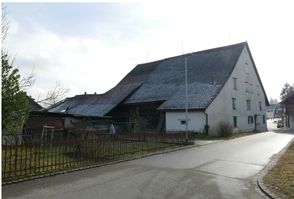
Vielzweckbauernhaus, Nord- und Westfassade mit Schleppdachanbauten, 27.01.2022 (Bild Nr. D100593_07).