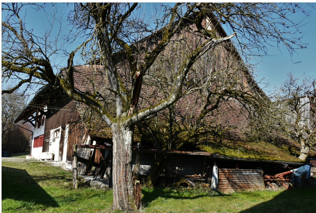
Vielzweckbauernhaus, Süd- und Ostfassade mit Schopf unter Pultdach, 08.03.2022 (Bild Nr. D100593_18).