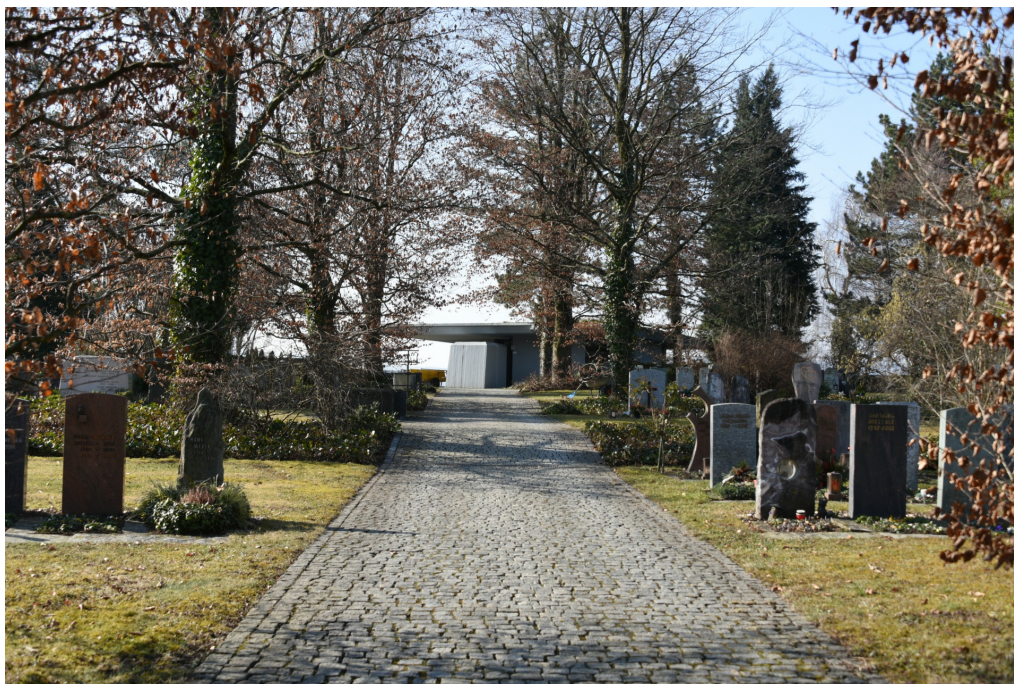
Friedhofgebäude mit Andachtshof, Ansicht von NO, 08.03.2022 (Bild Nr. D100593_37).