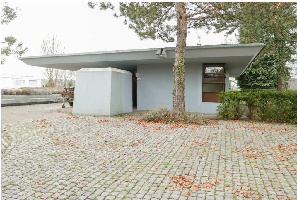
Friedhofgebäude mit Andachtshof, Ansicht von NO, 17.11.2015 (Bild Nr. D100593_27).