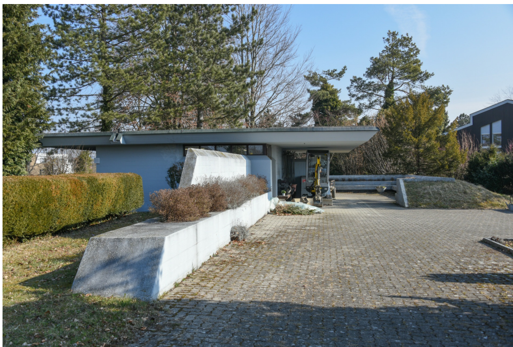
Friedhofgebäude mit Andachtshof, Ansicht von SW, 08.03.2022 (Bild Nr. D100593_51).