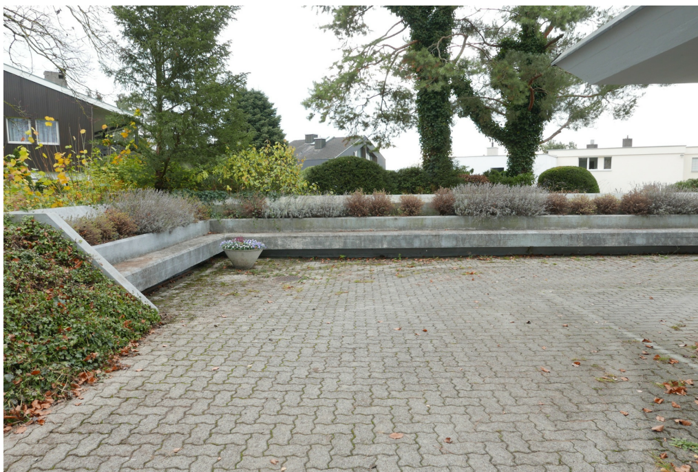
Friedhofgebäude mit Andachtshof, Andachtshof (054HOF00201), Ansicht von NW, 17.11.2015 (Bild Nr. D100593_32).