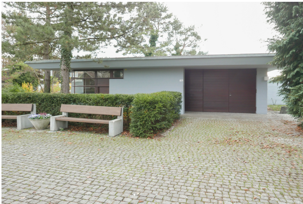
Friedhofgebäude mit Andachtshof, Ansicht von NW, 17.11.2015 (Bild Nr. D100593_29).