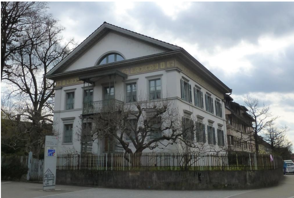
Wohnhaus «Zum Neuhof», Ansicht von N, 21.03.2017 (Bild Nr. D101097_61).