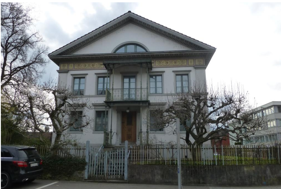
Wohnhaus «Zum Neuhof», Ansicht von NO, 21.03.2017 (Bild Nr. D101097_62).